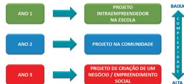
Figura 8.6: Propostas de trilhas empreendedoras para o componente curricular Empreendedorismo.

O desenho da matriz curricular do Empreendedorismo para rede estadual do Rio de Janeiro prevê três trilhas empreendedoras, uma para cada ano do ensino médio, sendo que cada uma delas tem como eixo norteador um projeto empreendedor. Tais projetos vão ganhando complexidade ao longo dos anos, e o primeiro deles é justamente um projeto intraempreendedor envolvendo o ambiente escolar.